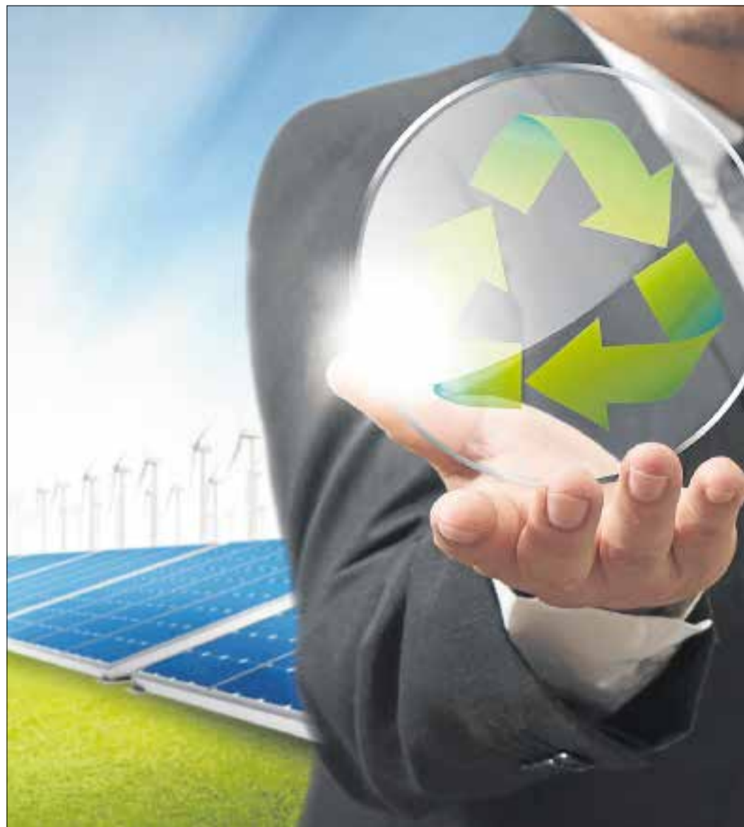
Dansk Byggeri efterlyser mere fokus på de muligheder, der ligger i energieffektivisering.

– Der er ingen grund til, at Danmark ligger og roder så langt nede på listen. Vi har potentiale til at kravle højere op, når det handler om at nå FNs verdensmål for bære-