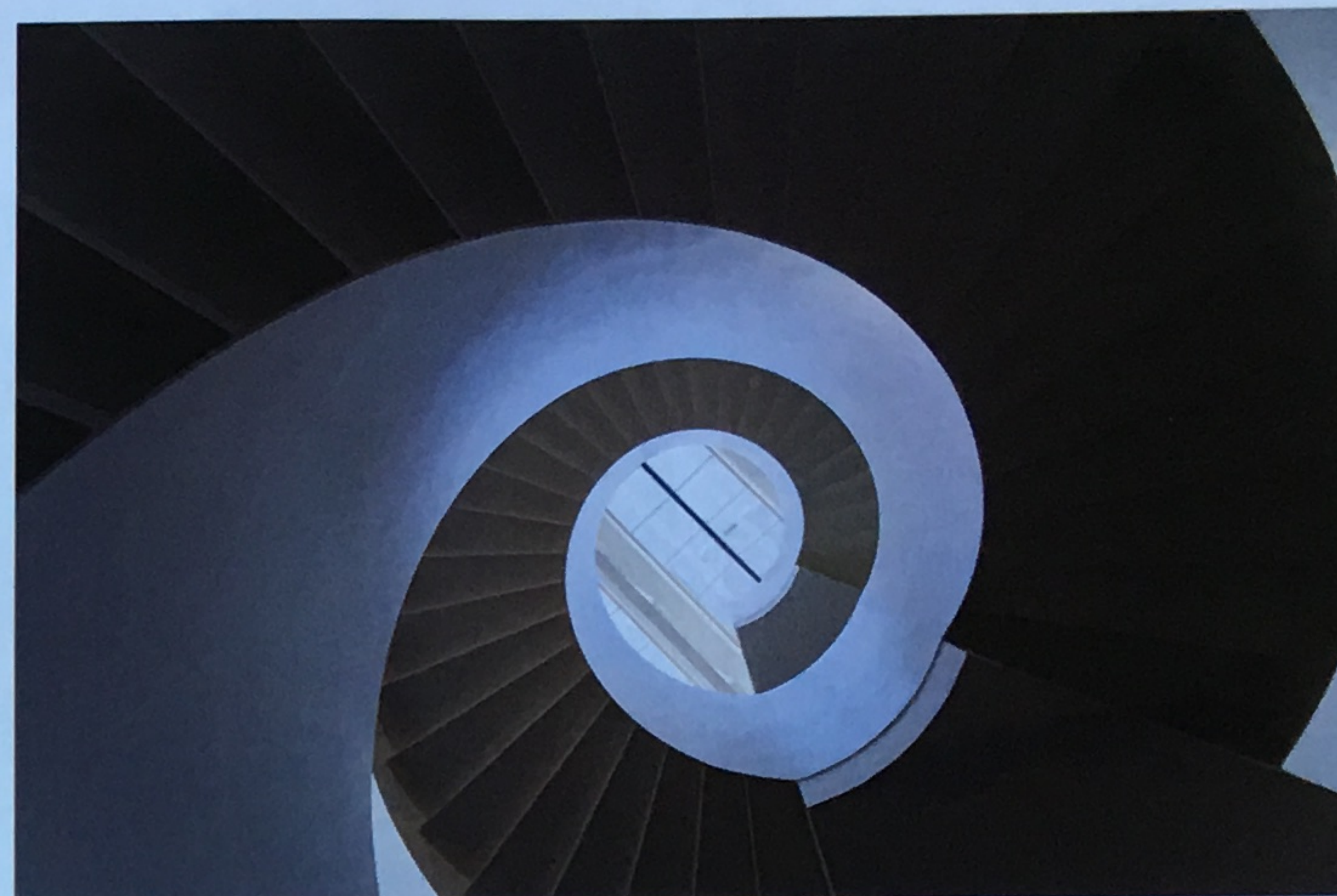
Retten i Roskilde

– Når man tænker indretningen med i arkitekturen, så er det ofte et spørgsmål om at fokusere på