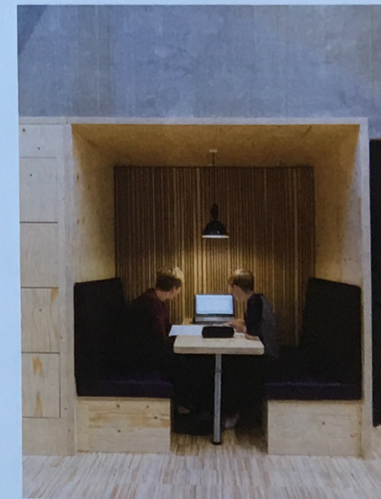
Katrinédals Skole