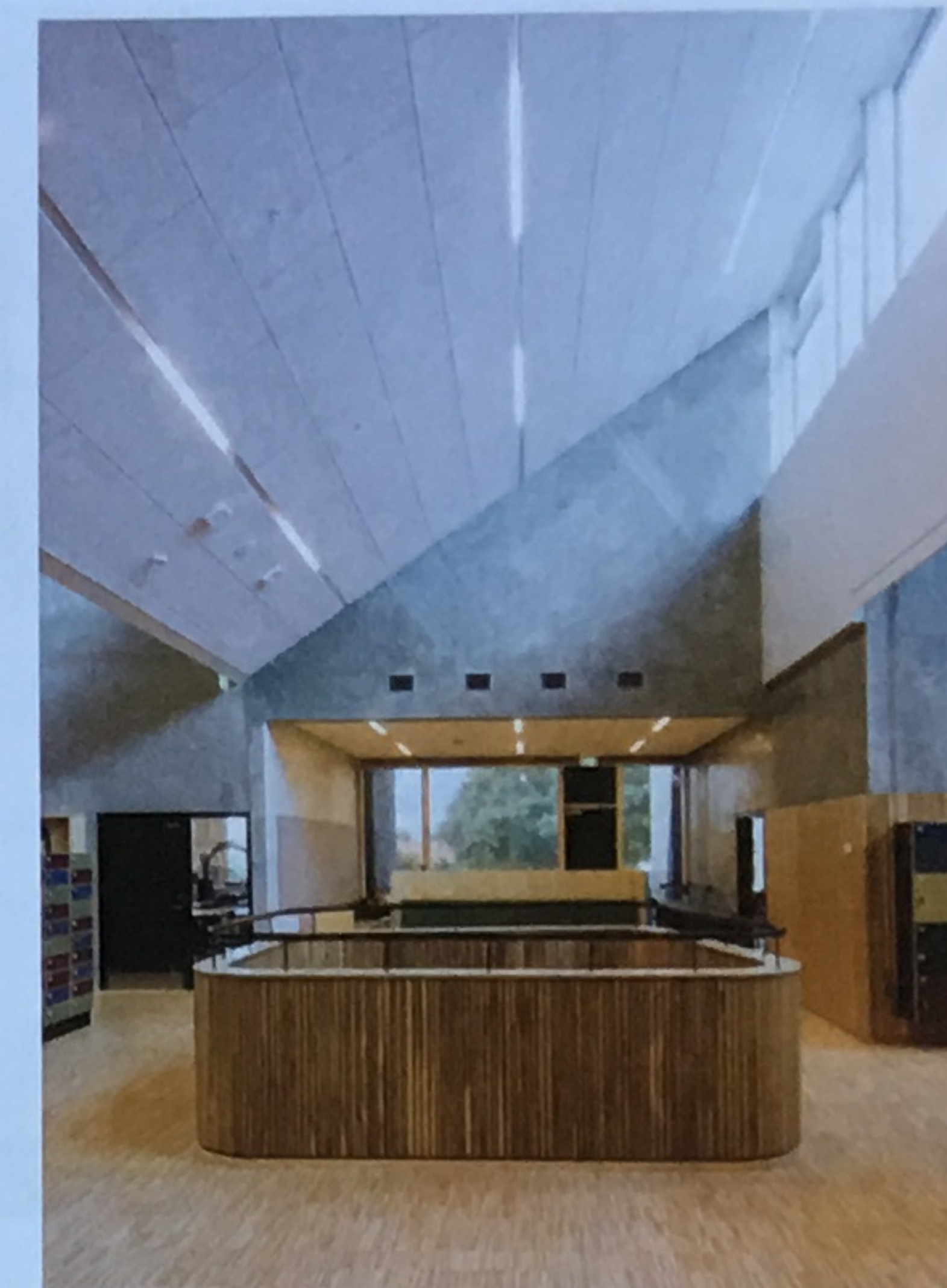
Katrinédals Skole.

– Fremtiden byder både på større specialisering, men samtidig vil dygtige generalister få endnu større indflydelse. Og her har arkitekterne både overblikket og kompetencerne. Med nye AB-regelsæt er der allerede kommet større efterspørgsel >